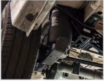
SUSPENSION PNEUMATIQUE INTÉGRALE

En plus des produits de la catégorie « pièces spéciales », nous proposons également une large gamme d'autres produits. Nos produits sont subdivisés en quatre groupes de produits. Ceux-ci se composent d'un large éventail de systèmes destinés à de nombreuses marques et de nombreux modèles. Voilà pourquoi il existe toujours une solution qui vous convient.