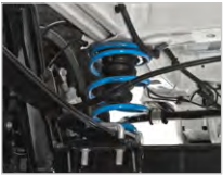
RESSORTS AUXILIAIRES ET DE RENFORCEMENT